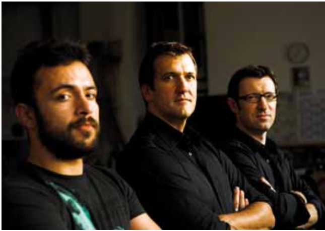
Bandfoto von "The bloody chickenheads". Am 29. Juni treten sie im Schlosshof in Pfullingen auf.