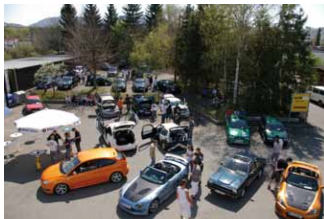
Pimpday bei Bosch-Maier: Am 7. Juni veranstalten die vier Firmen Bosch-Maier, Küchen Boley, Metall Heinlin und RS Design gemeinsam hier eine Leistungsschau.