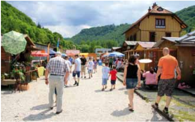
Viel hübsches Kunsthandwerk rechts und links des Wegs kann man wieder bewundern auf dem Honauer Markt.

(KB) Bereits zum 12. Mal gibt es ein Bahnhofsfest und dieses Jahr genau am 121. Eröffnungstag der unteren Echazbahn von Reutlingen nach Honau. Denn am 2. Juni 1892 fuhr in feierlichem Schmuck und von Musik begleitet der erste offizielle Zug vom Reutlinger Hauptbahnhof in Richtung Honau. Gegen 11.15 Uhr morgens erreichte der Zug, bei strahlendem Sonnenschein, den festlich geschmückten Honauer Bahnhof. Böllerschüsse begrüßten Zug und Gäste. Prominente aus nah und fern, unter ihnen Ministerpräsident Dr. Freiherr von Mittnacht, waren gekommen, um die erste normalspurige Nebenbahn in Württemberg zu eröffnen. Die Feuerwehren aus den umliegenden Orten standen Spalier. Reden wurden gehalten und die Musik- und Gesangsvereine gaben ihr Können zum Besten. Abends um 18.26 Uhr fuhr der Zug nach Reutlingen zurück. Das Echaztal war an die große, weite Welt der Eisenbahn angeschlossen. Erst gut ein Jahr später, am 1. Oktober 1893 konnte die Teilstrecke nach Lichtenstein (Württ.) und weiter nach Kleinengstingen und Münsingen eröffnet werden. Und genau dieses Ereignis nimmt der Förderverein Bahnhof HONAU als Basis für sein Bahnhofsfest.