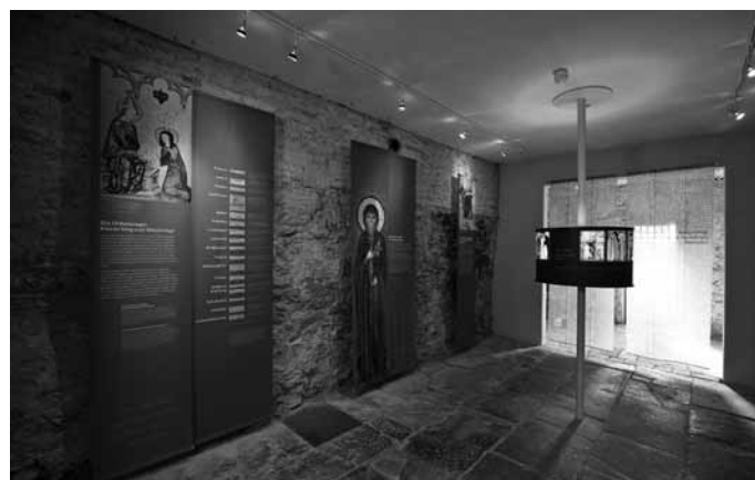
Die Pfullinger Sonntagstouren bieten schöne, interessante Einblicke in die Pfullinger Geschichte und ihre Ausstellungen. Wie oben in der Klosterkirche oder unten im Trachtenmuseum.

Überraschungen. Ein gutes Gastronomie- und Einkehrangebot sowie die an den Sonntagnachmittagen (von Mai bis Oktober) von 14.00 Uhr bis 17.00 Uhr geöffneten Museen (freier Eintritt) versprechen erlebnisreiche Stunden. Mehr Infos unter: Tel. 07121/703-207, oder per Mail: tourismus@pfullingen.de .