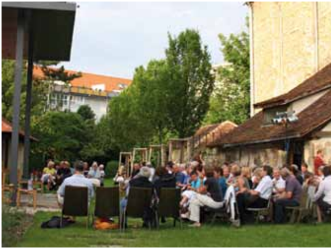
Freiluftveranstaltungen wie hier ein Kabarettabend im Klostergarten, werden auch in diesem Jahr wieder im Sommerprogramm der Vhs Pfullingen angeboten.

(vhs) Seit über 10 Jahren ist es bei der vhs Pfullingen nun üblich, für die „warme Jahreszeit“ ein „kleines, feines, zusätzliches Sommerprogramm“ anzubieten. Ca. 40 Kurse und Veranstaltungen für die Zeit von Mitte Juni bis Mitte September sind von den vhs-Verantwortlichen zusammengefasst worden. Verteilt wird das in A5 gedruckte Programm als Beilage in Pfullingen in dieser Ausgabe des Pfullinger Journals. Selbstverständlich steht es auch im Internet unter www.vhs-pfullingen.de . In den Nachbargemeinden liegt es bei Banken, Sparkassen, Einzelhandelsgeschäften und Apotheken aus. Anmeldungen zu den Kursen sind ab sofort möglich.